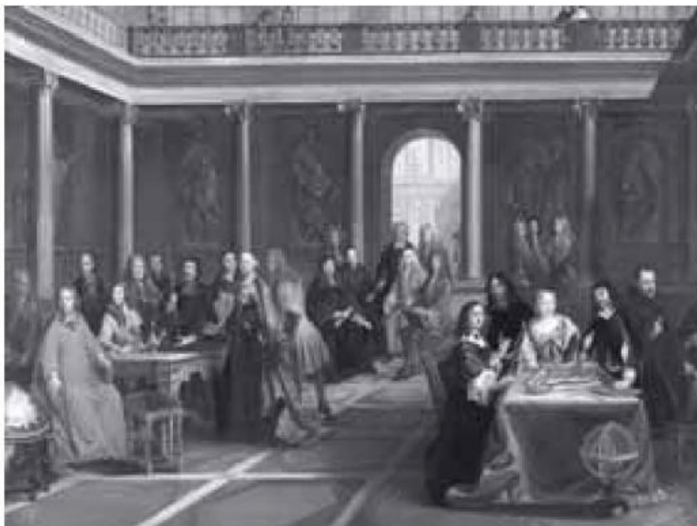
Ilustración 1.1 Descartes en la Corte de la reina Cristina de Suecia

Son muchos los ejemplos en los que podemos pensar para ilustrar esa querencia que los no poderosos política o económicamente sienten hacia el poder. Me limitaré a recordar el caso de René Descartes (1596-1650).