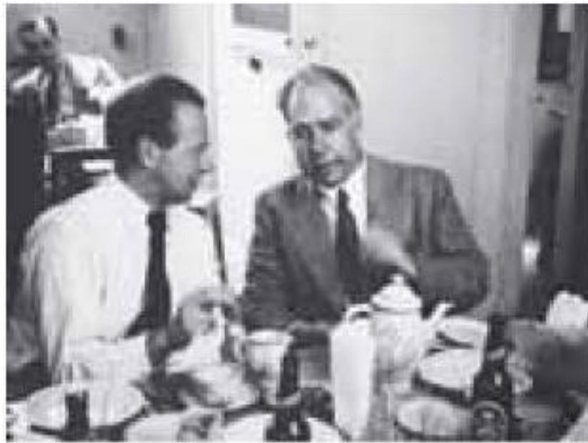
Ilustración 3.4 Werner Karl Heisenberg y Niels Bohr

Wissenschaftliches Institut (Instituto Alemán de Cultura). 23 Durante su visita, se entrevistó privadamente con su antiguo mentor, colega y amigo Niels Bohr. Sobre lo que pudieron haber hablado es de lo que Frayn trata en su obra. Posteriormente, sin embargo, se han hecho públicas una serie de cartas existentes en el Archivo Bohr, en Copenhague, que después de la guerra intercambiaron Bohr y Heisenberg y que arrojan luz sobre lo que sucedió. Aquí yo me limitaré a citar la primera de esas cartas, una, de hecho, que su autor, Bohr, nunca llegó a enviar (no está datada, pero debió ser escrita en 1957), y que incide en las cuestiones a las que aludía Meitner: 24