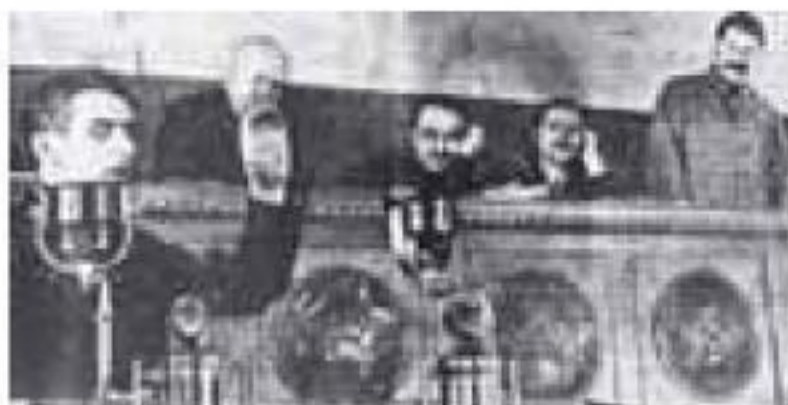
Ilustración 4.4 Trofim Lisenko en un discurso pronunciado en el Kremlin en 1935. En la escena, y de izquierda a derecha, se encuentran Stanislav Kosior, Anastas Mikoyan, Andrei Andreev y el líder Joseph Stalin