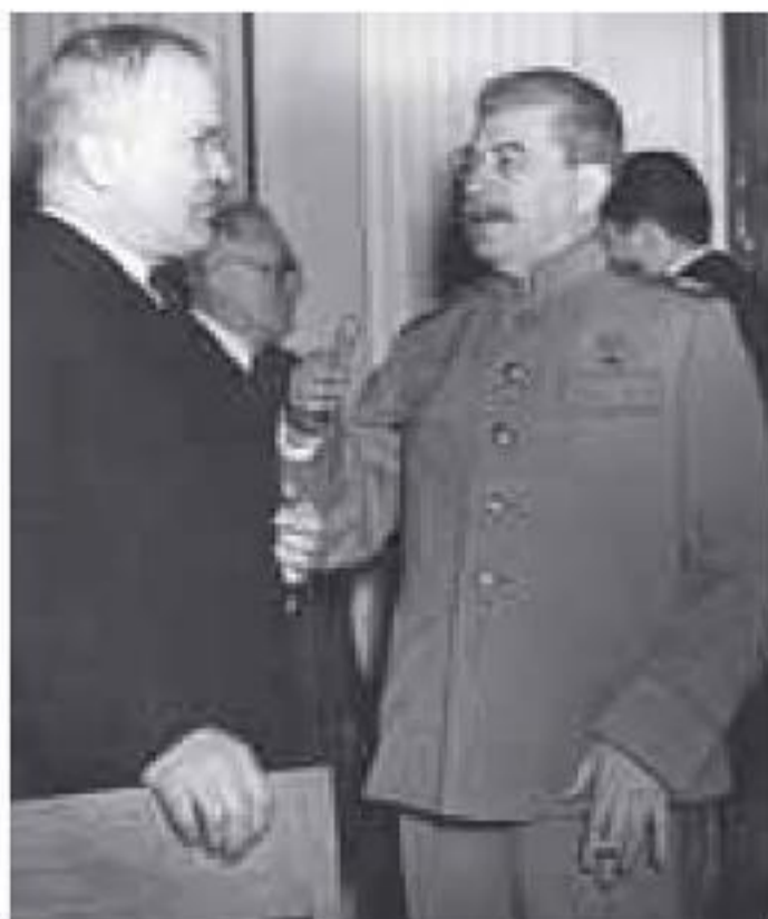
Ilustración 4.3 Stalin conversa con Molotov, su ministro de Asuntos Exteriores, durante la Conferencia de Yalta, en febrero de 1945

ta el primer satélite construido por el hombre, el Sputnik , se supo que, al menos en parte, aquel eslogan se había hecho realidad.