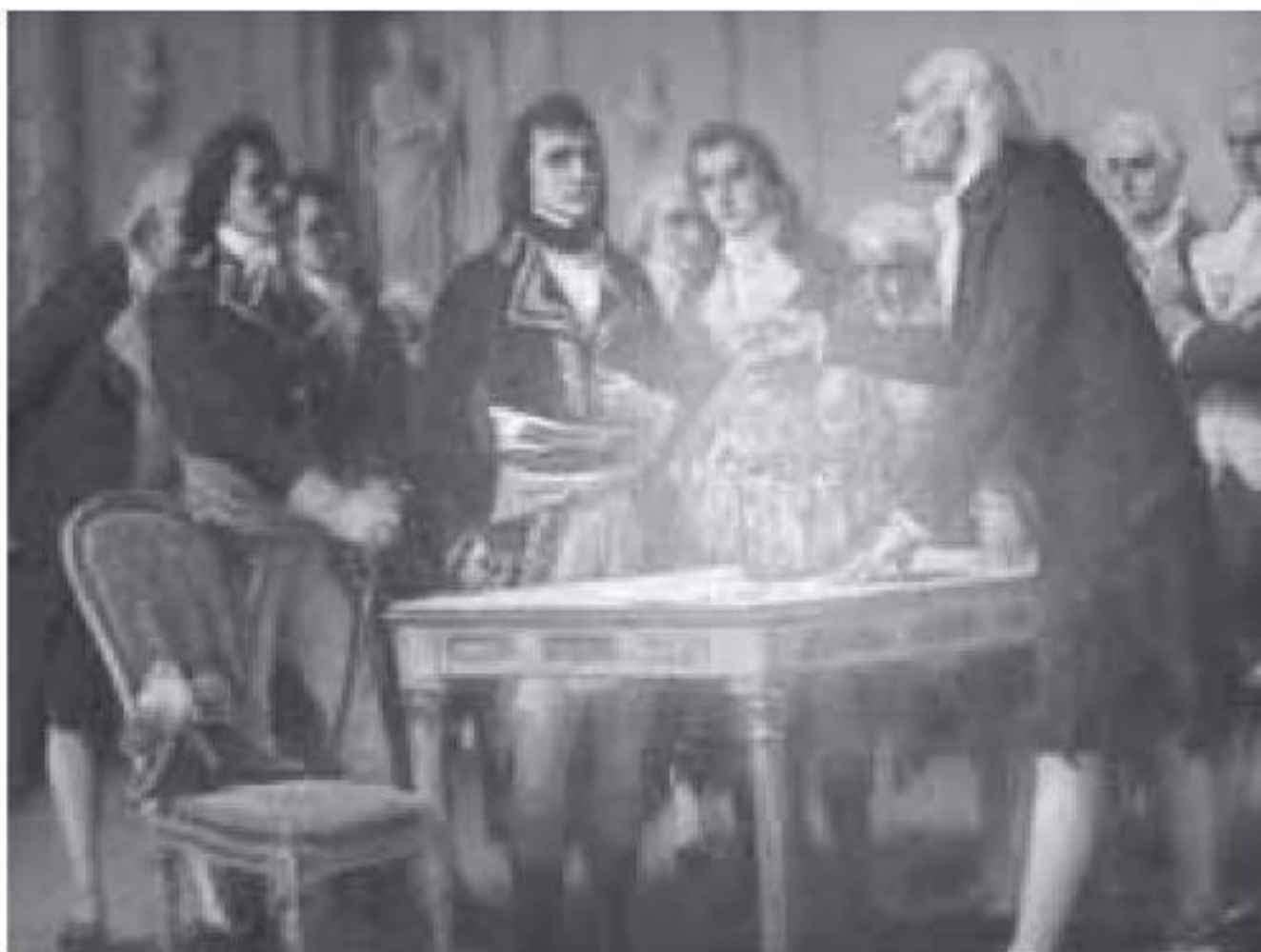
Ilustración 2.7 Alessandro Volta presenta su pila voltaica a Napoleón Bonaparte en 1801

y galvanismo comparables a los realizados por Benjamin Franklin y Alessandro Volta.