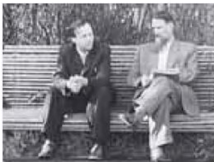
Ilustración 4.2 Andréi Sajarov e Igor Kurchatov

una mezcla de uranio y agua pesada, algo que no podían probar al no poseer cantidades importantes de agua pesada.