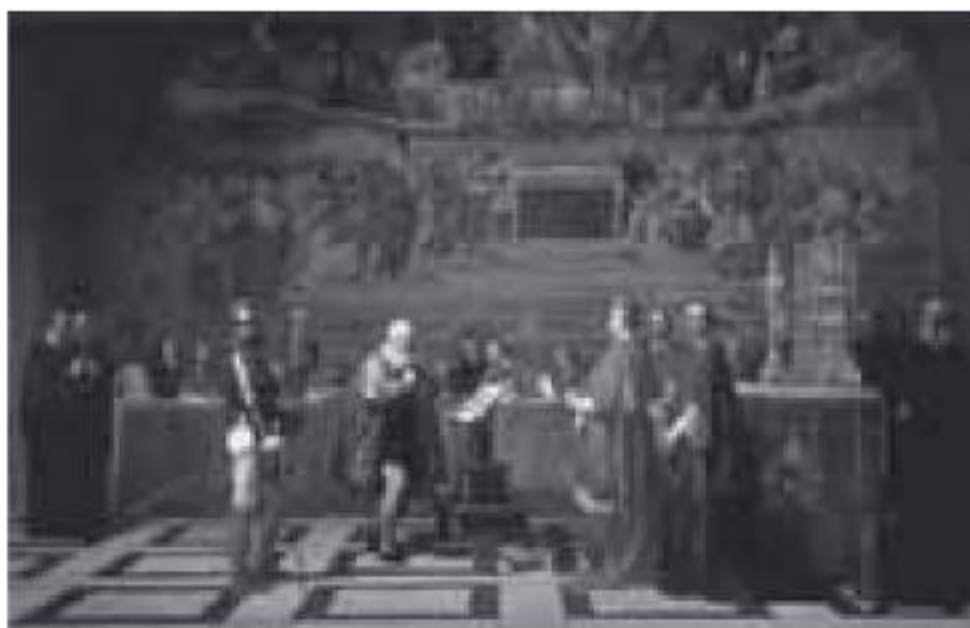
Ilustración 1.2 Galileo Galilei ante el Santo Oficio