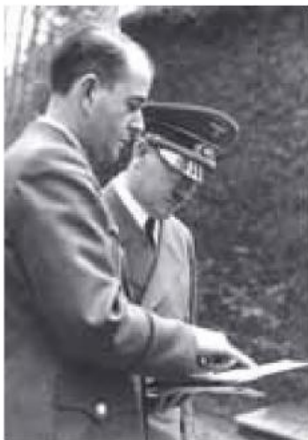
Ilustración 3.2 El ministro de Armamento y Munición, Albert Speer, durante una entrevista mantenida con Adolf Hitler en el Cuartel General del Führer, en junio de 1942

una influencia perniciosa en la física nuclear por medio de la teoría de la relatividad. Invocando la opinión de su ilustre compañero de partido, en sus conversaciones de sobremesa Hitler había llegado a tachar la física nuclear de ‘física judía’, lo cual no sólo fue cogido al vuelo por Rosenberg, sino que también hizo que el ministro de Educación dudara sobre el apoyo que debía prestar a la investigación nuclear».