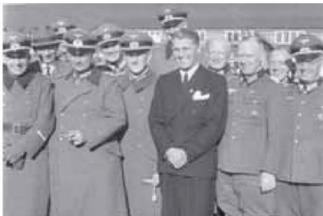
Ilustración 3.3 Wernher von Braun, vestido de civil, entre oficiales del Ejército alemán, en Peenemünde, la planta de cohetes del Instituto de Investigación del Ejército, en la primavera de 1941

el 3 de octubre de 1942 el primer cohete —o, como diríamos ahora, misil— balístico experimental tierra-tierra fue lanzado con éxito desde Peenemünde-Este. En su momento de máximo esplendor, Peenemünde contó con un personal dedicado a tareas de investigación y desarrollo formado por unas seis mil personas, de las cuales alrededor de cien eran ingenieros. Otros seis mil eran trabajadores «de a pie», entre ellos muchos forzados, procedentes o no de campos de concentración.