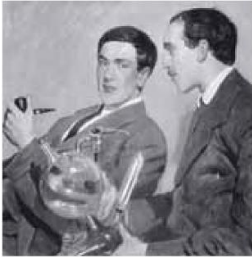
Ilustración 4.1 Piotr Kapitza y Nikolai Semenov