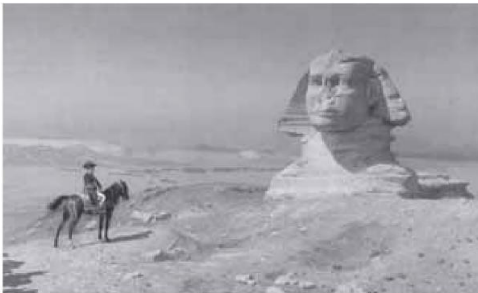
Ilustración 2.6 Napoleón Bonaparte ante La Esfinge (El Cairo, Egipto)