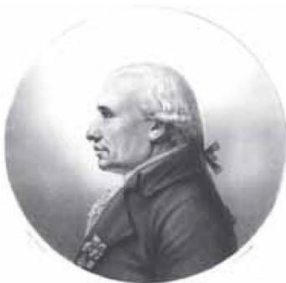
Ilustración 2.2 El matemático Gaspard Monge