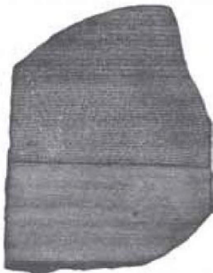
Ilustración 2.4 Piedra Rosetta (el-Rashid, Rosetta, Egipto), del período ptolemaico

podría servir de molde, adelantándose en unos diez años a la invención de la litografía. Después de lavar la piedra y derramar tinta sobre la superficie ya seca, se presionó suavemente una lámina que al contacto con las partes que sobresalían produjo una reproducción perfecta del texto, las letras en blanco sobre un fondo negro (debido a la tinta que utilizaron, convirtieron la piedra de blanca en negra, como se puede comprobar cuando se la ve hoy). También se realizó una copia empleando las técnicas que se utilizaban en placas de cobre, y más tarde un molde. Para los franceses fue afortunado que se hicieran todos estos trabajos, ya que de otra manera se habrían quedado sin nada, puesto que la Piedra Rosetta, junto a otros tesoros arqueológicos encontrados por el ejército galo, pasó a manos de los británicos como botín de guerra tras la derrota del ejército de Napoleón: llegó a Inglaterra en febrero de 1802, siendo depositada en la Sociedad de Anticuarios de Londres, donde se hicieron copias para las universidades de Oxford, Cambridge, Edimburgo y Dublín. Finalmente terminó en el Museo Británico de Londres, acompañada de una placa en la que no se dice nada del papel de los franceses en su descubrimiento.