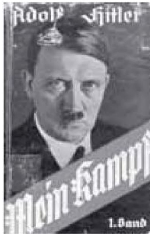
Ilustración 3.1 Cubierta del primer tomo de Mein Kampf ( Mi lucha ), la obra de Adolf Hitler publicada el 18 de julio de 1925

es en un período en el que dominan la tecnología y la química que engloban las características que son más visibles en la vida diaria, es igualmente peligroso cuando la educación de una nación se dirige cada vez más exclusivamente hacia ellas. La verdadera educación, por el contrario, debe ser siempre ideal. Debe ajustarse más a los temas humanísticos y ofrecer solamente las bases para una subsiguiente educación en un campo especial. De otra forma, renunciamos a fuerzas que todavía son más importantes para la conservación de la nación que toda habilidad técnica o de otro tipo. Especialmente en lo que se refiere a la educación histórica, no nos debemos apartar del estudio de la antigüedad. Entendida correctamente, a rasgos extremadamente amplios, la historia romana continúa siendo el mejor mentor, no sólo en la actualidad sino probablemente para siempre. Deberíamos conservar, en su ejemplar belleza, el ideal heleno de cultura. No debemos permitir que la gran comunidad racial se deshaga debido a las diferencias entre los individuos. La lucha que tiene lugar hoy es por fines muy elevados. Una cultura que combine milenios y que una helenismo y germanismo está luchando por su existencia.