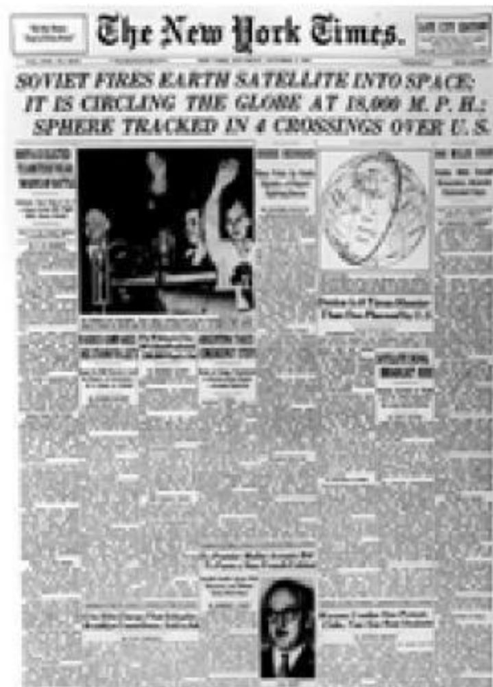
Ilustración 5.1 Portada de The New York Times , informando sobre el lanzamiento del Sputnik por parte de la Unión Soviética, el 4 de octubre de 1957

pública y de que, por consiguiente, tenía que reaccionar. «Este hecho», escribió (Eisenhower 1963, 205), «precipitó una ola de aprehensión a lo largo del mundo libre. Comentaristas de periódicos, revistas, radio y televisión se unieron al hombre de la calle en expresiones de desaliento acerca de esta prueba, de que los rusos ya no podían ser considerados como ‘retrasados’ y que habían incluso ‘batido’ a los Estados Unidos en una espectacular competición científica. La gente se acordaba con preocupación ahora de que solamente unas pocas semanas antes la Unión Soviética había anunciado al mundo su primera prueba con éxito de un ICBM [InterContinental Ballistic Missile] de varias fases, un logro que, decían los soviéticos, demostraba que podían lanzar un misil ‘a cualquier parte del mundo’».