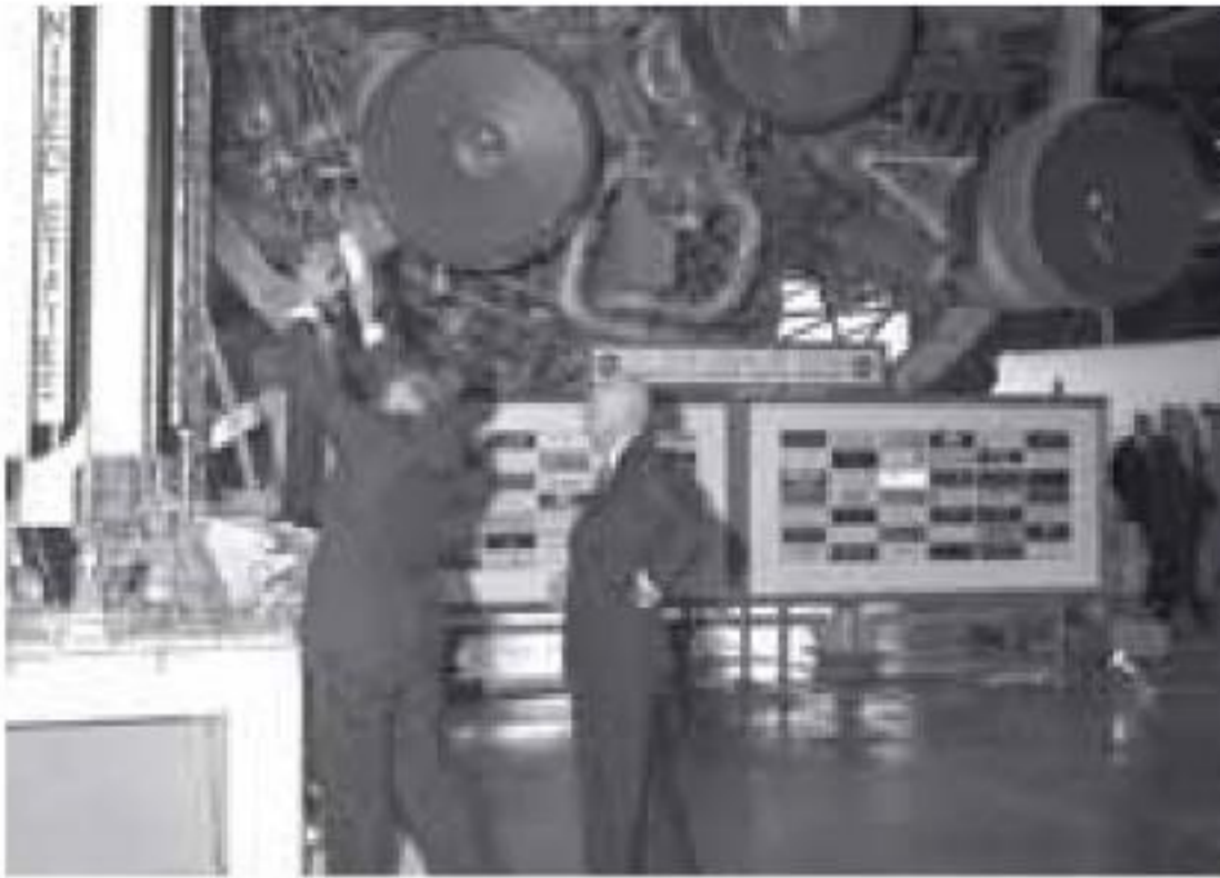
Ilustración 5.3 El Dr. von Braun da explicaciones al presidente Eisenhower acerca del Saturn 1 , en la visita que realizó al Marshall Space Flight Center el 8 de septiembre de 1960

potenciales que se deben obtener de oportunidades que surgirán y problemas implicados en la utilización de las actividades aeronáuticas y espaciales para fines pacíficos y científicos.