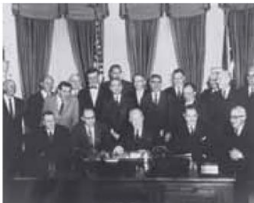
Ilustración 5.2 Reunión del Comité Asesor para Ciencia del Presidente (el PSAC), el 19 de diciembre de 1960. Sentados en primera fila, de izquierda a derecha, James Fisk, George Kistiakowsky, Dwight D. Eisenhower, James Killian e Isidor Rabi

produjeron durante la primera etapa de su Presidencia. Sucesos como el comportamiento de Richard L. Garwin (n. 1928), un físico de IBM que el sucesor de Eisenhower, Kennedy, ya había nombrado en 1961 para el Comité Asesor para Ciencia del Presidente y que Nixon reeligió en 1969, a pesar de que Garwin se oponía al programa de misiles antibalísticos que defendía el presidente. Como miembro del Comité, Garwin presidió un comité para estudiar un proyecto que Richard Nixon apoyaba y daba gran importancia política: el del transporte supersónico, al que el Congreso se oponía por motivos de coste, viabilidad económica, y miedo a contaminación sónica y estratosférica. Al testificar ante el Subcomité del Congreso que debía decidir sobre si autorizar o no el programa, Garwin reconoció su pertenencia al Comité del presidente, pero añadió: «Quiero destacar que estoy hablando ahora como un individuo y no como representante de algún grupo o persona», manifestando a continuación su oposición al proyecto. Se- mejante comportamiento debió reforzar las opiniones (prejuicios) de Nixon sobre los científicos; así, en una conversación que mantuvo en 1971 con alguno de sus colaboradores y que fue grabada, saliendo a la luz posteriormente, realizó comentarios vejatorios sobre sus asesores