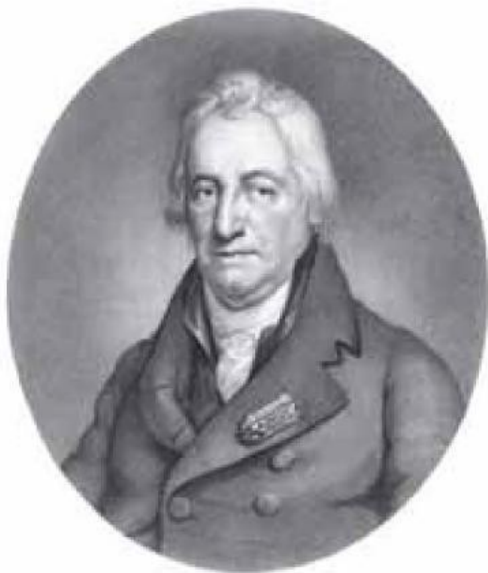
Ilustración 2.3 Claude Louis Berthollet

laba que en el futuro los alumnos tendrían que pagar sus gastos de escolaridad, algo que era doblemente deseable ya que el Estado, escaso de dinero, no se podía permitir continuar asegurando a la Escuela el medio millón de francos que recibía anualmente.