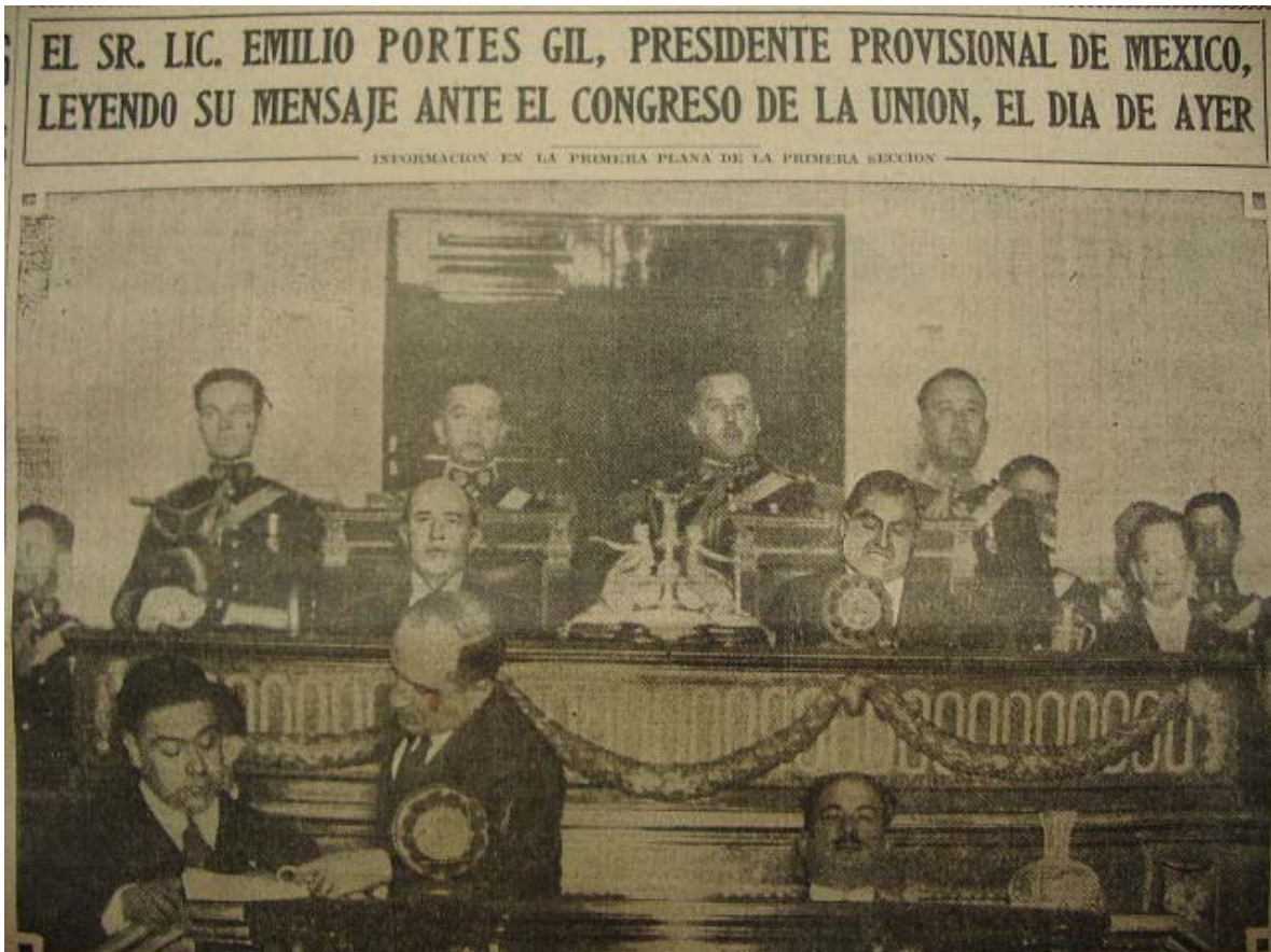
Excelsior , 2 de septiembre de 1929.